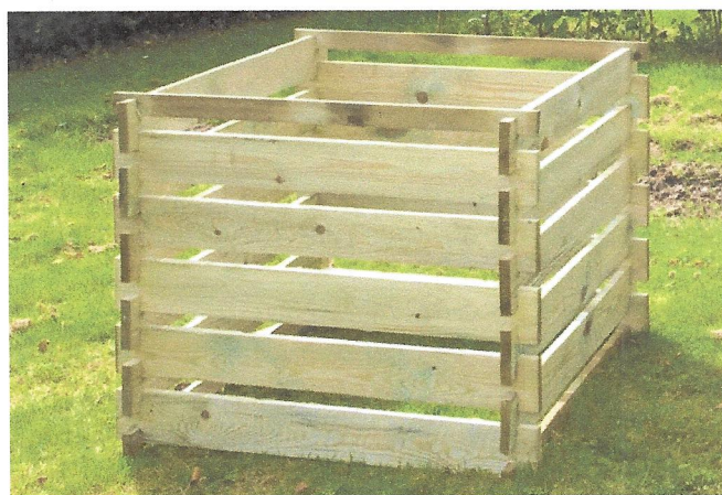
Slika 2 : Kompostnik iz lesa