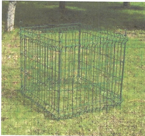
Slika 3 : Kompostnik iz kovinske žice