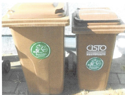
Slika 1 : Tipski zabojnik za zbiranje biološko razgradljivih odpadkov

Vaš zbiralec odpadkov: Čisto mesto Ptuj, d.o.o.